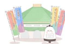
Illustration by kaori 好角家入門 sumofan.jp

●オリジナルで作成した座席表のため、あくまでも参考程度にご覧ください。 ●この座席表に関する何かしらのクレーム、責任等は負いかねますのであらかじめご了承ください。 ●トラブル防止のため、画像のみの無断転載はお控えください。（ページのリンクは天天夫です）